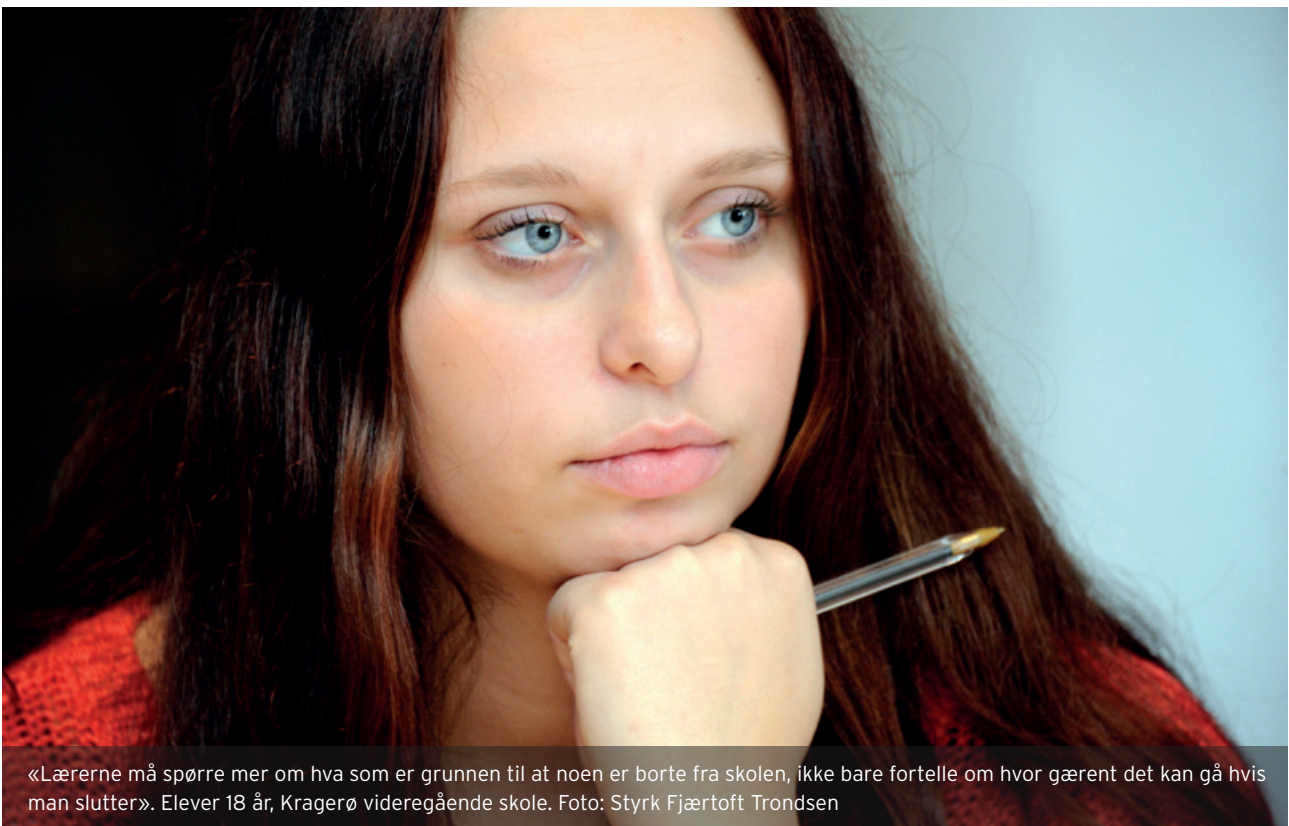
«Lærerne må spørre mer om hva som er grunnen til at noen er borte fra skolen, ikke bare fortelle om hvor gærent det kan gå hvis man slutter». Elever 18 år, Kragerø videregående skole.

Fasen fra plan til handling er meget krevende. Arbeidsgruppene som jobbet med «Gode overganger» og «Foreldresamarbeid» fant at det allerede var mange gode prosedyrer og planer. Utfordringen var at disse i ulik grad var innarbeidet i ordinær praksis. Dette ser vi på som en særlig utfordring som må tillegges mye vekt i arbeidet med det nye satsingsområdet for 2014 «Færre på passive ytelser». Arbeidsgruppens betydelige innsats vil langt på vei være bortkastet om det ikke fokuseres tilstrekkelig på gjennomføring av forbedringstiltakene.