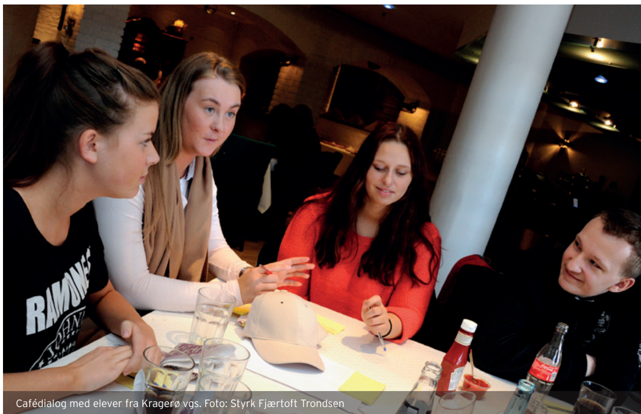
Cafédialog med elever fra Kragerø vgs.

Høgskolen i Telemark skal bidra med å lage en rapport hvor satsingen evalueres. Her skal det ses nærmere på blant annet forankring, implementering og resultatrapportering. Hovedhensikten med evalueringen vil være å styrke kompetansen på utviklingsarbeid.