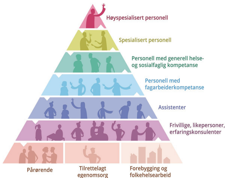
Figur 1 NOU «Tid for handling» viser omsorgstrappen i tjenestebehovet. dette gir et godt bilde på hvor viktig og avgjørende folkehelsearbeid er for å lykkes med utfordringene vi står ovenfor.

Utviklingsbildet viser at det ikke er mulig å bemanne seg ut av alle utfordringene som helse- og omsorgstjenesten kommer til å stå ovenfor. Helt uavhengig av det fremtidige økonomiske handlingsrommet, er det tilgangen på kvalifisert personell som begrenser tjenestene og hindrer dem i å utvikle seg videre med dagens innretning. Hovedprioriteten i årene fremover vil derfor være å utvikle tiltak og investere i løsninger som gir lavest mulig personell vekst.